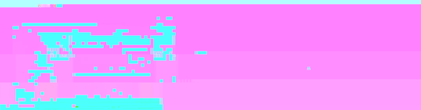
教育学院2010年度学术交流会现场